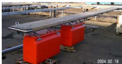
8 m gångbar båtbom 2 x 250 l