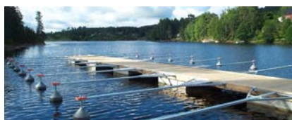
Aremark 2002 – grå flytkroppar