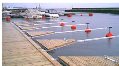
Sjöparken Horten Norge