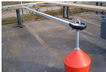
5 m förtöjningsbom 1x60 l